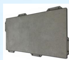
Гладкий камень серый