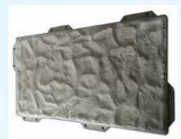
Колотый камень серый